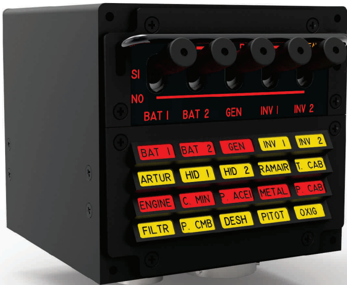
Panel de Alarmas Copiloto

Los paneles de alarmas, que equipan al avión IA-63 Pampa en el puesto piloto y copiloto, centralizan las alarmas WARNING y CAUTION que se generan en la aeronave, las cuales son anunciadas en forma luminosa mediante el encendido simultáneo en cada panel, de la indicación correspondiente, y en forma audible.